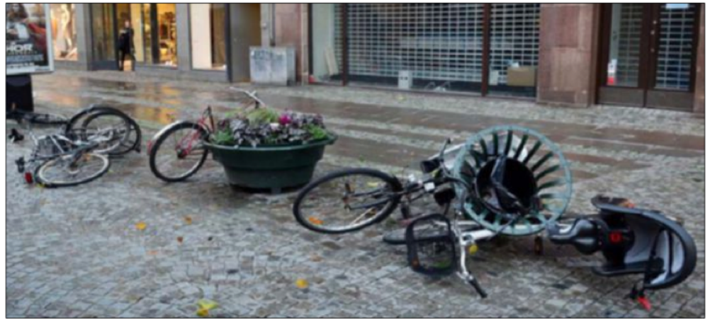
MISSHANDLAT TRANSPORTMEDEL. Cyklisten prioriteras bort i transportinfrastrukturpolitiken, anser dagens fem skribenter på Sidan 4, men de ser att staten har en chans att bättra sig i vårens nya transportplaner.

Vi tycker det är svårt att förstå trafikpolitikerna. Hur kan man tro att männis-