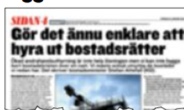
Sidan 4 den 24 januari.

vare sig uppifade friggebodar eller andrahandslägenheter, men är det verkligen det vi vill att landets unga ska ställa sitt hopp till för att komma in på bostadsmarknaden? Andrahandsuthyrning kan vara en tillfällig lösning, men det leder inte till en enda ny lägenhet. Och dessutom